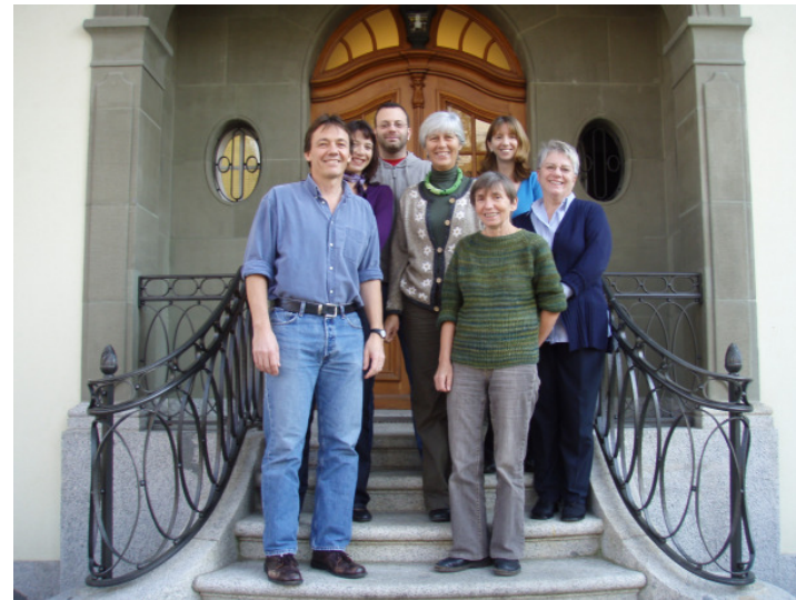
Der neue Vorstand der Support Group