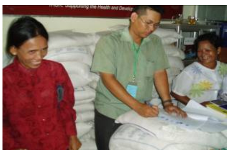
TASK Beim Verteilen der Reis-Rationen