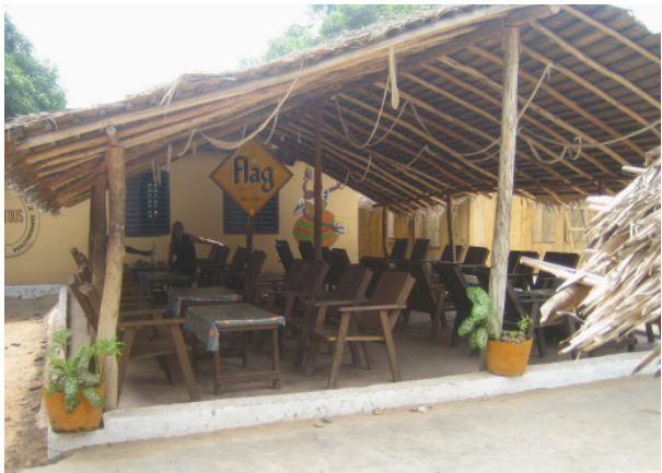
Café und Begegnungszentrum von NOUTOUS